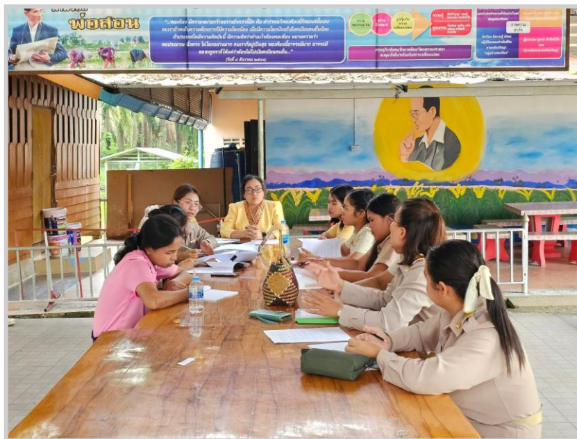
ประชุมวางแผน คณะครูและบุคลากรการดำเนินงานกิจกรรม