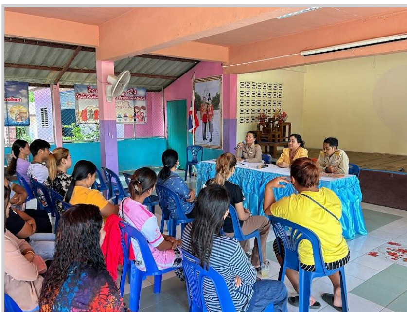
ประชุมวางแผนคณะผู้ปกครองการดำเนินงานกิจกรรม